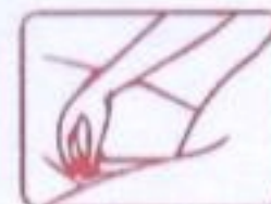
3. 取仰卧姿势将推进器插入阴道深部，压紧推杆将凝胶注入阴道。