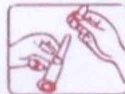
2. 取出凝胶，除去推进器的盖帽。