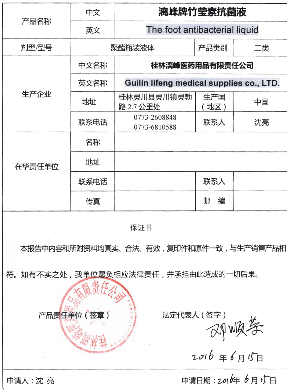
消毒产品卫生安全评价报告备案登记表