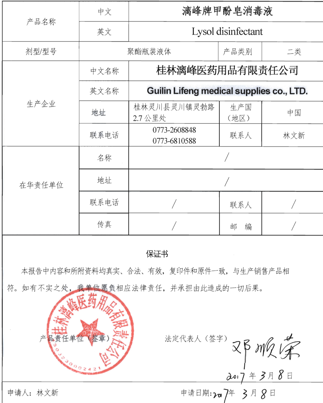
消毒产品卫生安全评价报告备案登记表