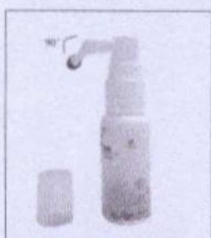
2. 取下防尘盖; 拨动转臂喷管, 使其侧转 90° (转臂喷管垂直状态为保护状态, 不能按下压力泵)