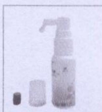
3. 取下转臂喷管下的护盖, 并摇动喷瓶。(请务必取下护盖以免卡住部位)