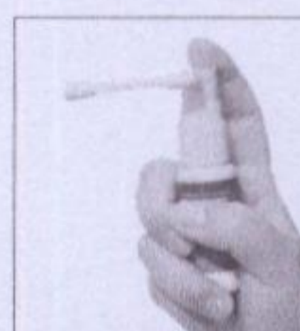
4. 将转臂喷管对准需要护理的部位, 快速连续按下压力泵 3-5 下。(按下压力泵需一次按压到底, 喷后还原)